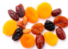
FRUTTA SECCA Dolcezza naturale, fibre e benefici antiossidanti in ogni morso.