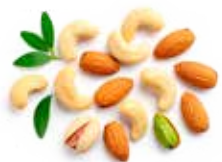
MIX DI FRUTTA SECCA Anacardi, arachidi, mandorle, pistacchi per energia e gusto.

SENZA glutine | FRUTTA REALE | ARACHIDI | ANACARDI | MANDORLE | PISTACCHI | SENZA olio di palma