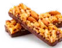
COPERTURA PROTEICA Finitura morbida che aggiunge proteine e gusto delizioso.